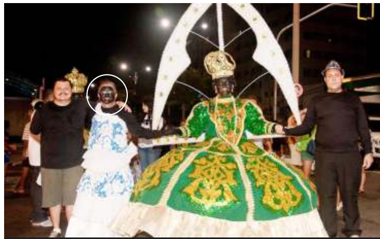
• Cantidio Brasil após o desfile oficial de carnaval do Maracatu Rei do Congo na Avenida Domingos Olímpio - Fortaleza - 2013