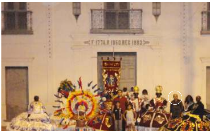
• Cantidio Brasil com integrantes do Maracatu Rei do Congo, do qual é um dos fundadores e principais integrantes - Aracati - 2012