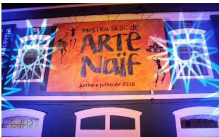
• Fachada do Sesc Iracema com obra de Cantidio Brasil, que ilustrou a identidade visual da Mostra Sesc de Arte Naïf - Fortaleza - 2016